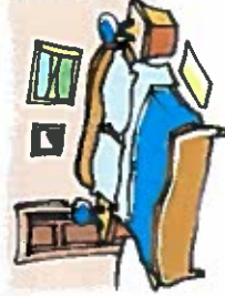
la camera da letto