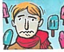
il fait froid