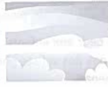
il y a du brouillard