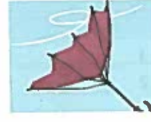
il y a du vent