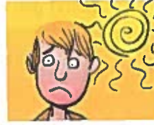
il fait chaud