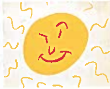
il fait beau